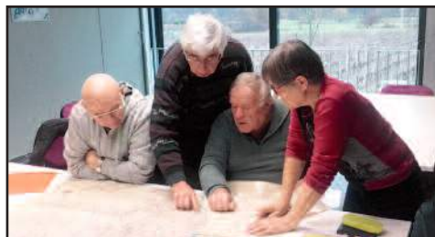
Recherche des Tuileries sur le cadastre napoléonien

Ils vous proposeront de remonter (le plus loin possible) dans l'histoire de certains quartiers (La Borie, La Rande, Touroulet, Les Sagniers, etc...) du village, et essaieront de rattacher chacun des quartiers évoqués à une personne emblématique du lieu, ou, à un événement insolite.