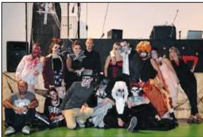
Une partie de l’équipe du Sou, lors de la soirée d’Halloween

Nouveauté cette année, nous avons fêté Halloween en présence d’un très grand nombre d’enfants et de parents. L’après-midi a été couronné de succès et le stand maquillage a été pris d’assaut. Les déguisements des petits et des grands étaient à la hauteur de l’événement !