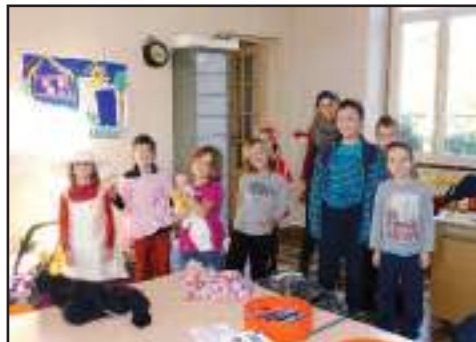
Les activités manuelles