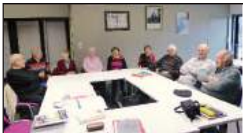
Rencontres et échanges

Toutes personnes ayant des photos et documents anciens peuvent nous les prêter par l'intermédiaire de la Mairie. Nous en prendrons grand soin et les rendrons rapidement. Nous les remercions par avance au nom de tous.