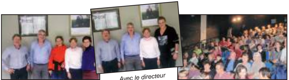
Avec les comédiennes

Le théâtre de Privas venu à Saint-Sernin a permis cette rencontre heureuse des citoyens qui veulent aussi mieux comprendre le sens de leur vie.