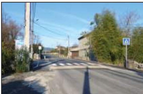
Plateau traversant route de Lachapelle

Les emplacements des dépôts de verres et de papiers ne sont pas un dépotoir d'objets de toutes sortes. Chacun est appelé à protéger et à respecter l'environnement.