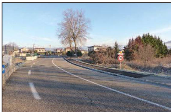
Entrée nord de la commune

La commission remercie les employés communaux qui interviennent et participent à l'entretien des voiries.