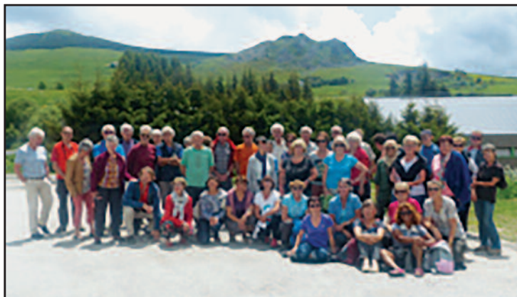
Sortie aux Estables

Ce mardi 5 juin, 48 randonneurs se sont retrouvés aux Estables pour une randonnée et un repas pris à l'auberge : « les Fermiers du Mézenc ». Même si les prévisions météo ont nécessité quelques changements dans l'organisation de la journée, tous les participants ont été très heureux de partager ces bons moments.