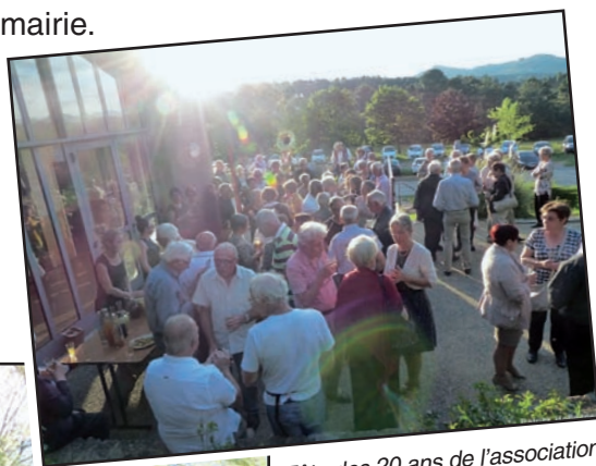
Fête des 20 ans de l'association