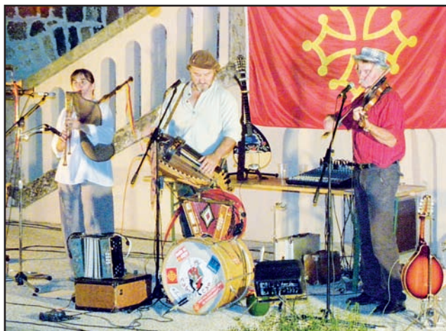
Le groupe Occitan « Cabre e Can »

Dans une ambiance conviviale, vous pouvez débiter ou vous perfectionner en dansant sur des musiques venues de toute la France et du Monde : danses bretonnes, gavottes, scottish, mazurkas, bourrées et bien d'autres encore sont au