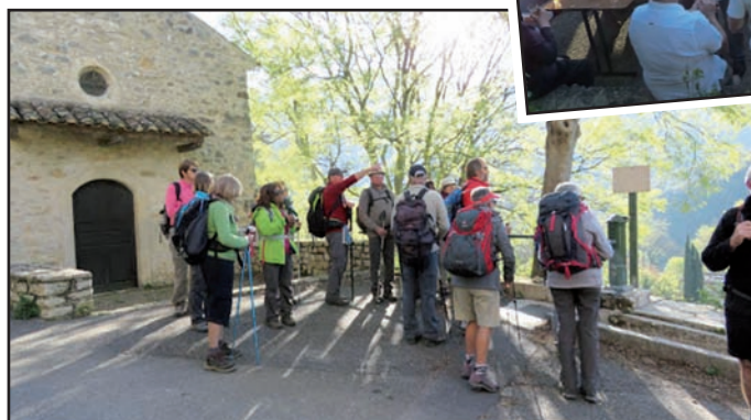
Randonnée à Chames (Gorges de l'Ardèche)