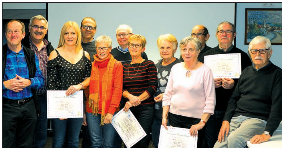
Maisons fleuries, le 8 décembre 2017.