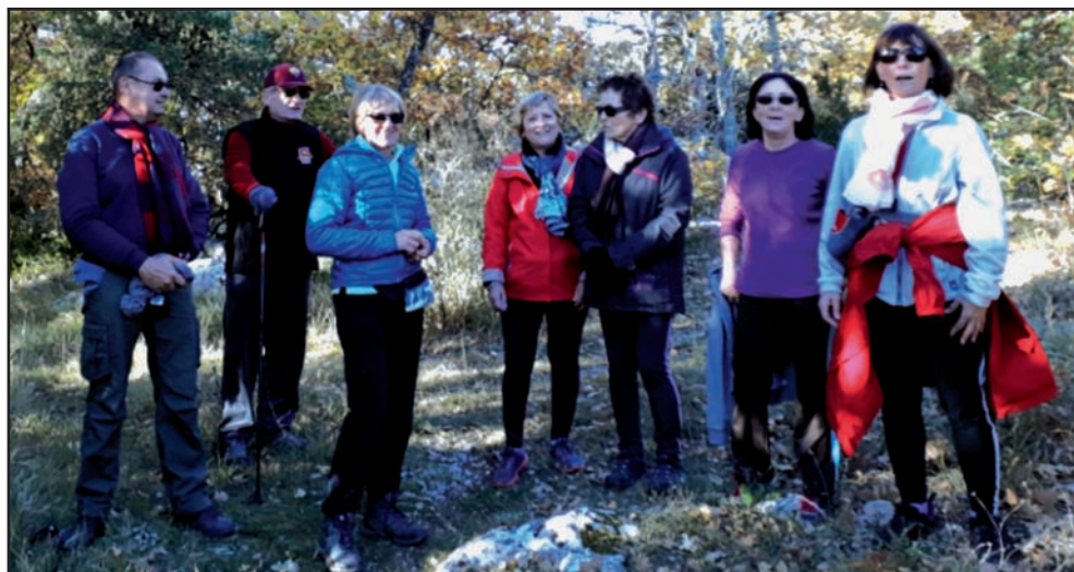
Sur le plateau de Lanas le 20/11/2017.

Les randonneurs sont animateurs à tour de rôle, surtout le mercredi. Selon la météo, la destination peut changer. Les animateurs repèrent la randonnée proposée avant de l'encadrer. D'autre part, la randonnée est un moment de convivialité et de partage, aussi l'animateur reste libre de se désister en cas d'empêchement. Un autre animateur prend le relais.