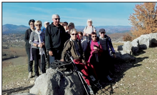
Jastre nord le 21/11/2017.

Randonnée du lundi, de 9 h à 10 h sur terrain semi-plat : marche rapide ou nordique d'environ 7 km. Le lieu est fixé pour un mois et change en fonction de la saison. Le groupe comprend une dizaine de personnes.