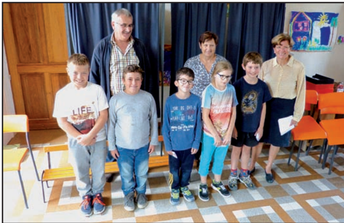
Election du Conseil Municipal des Enfants.

Dans les domaines de la voirie, de l'environnement et du sport, de la culture, les enfants élus pourront présenter leurs propositions et participer à la vie de la commune.