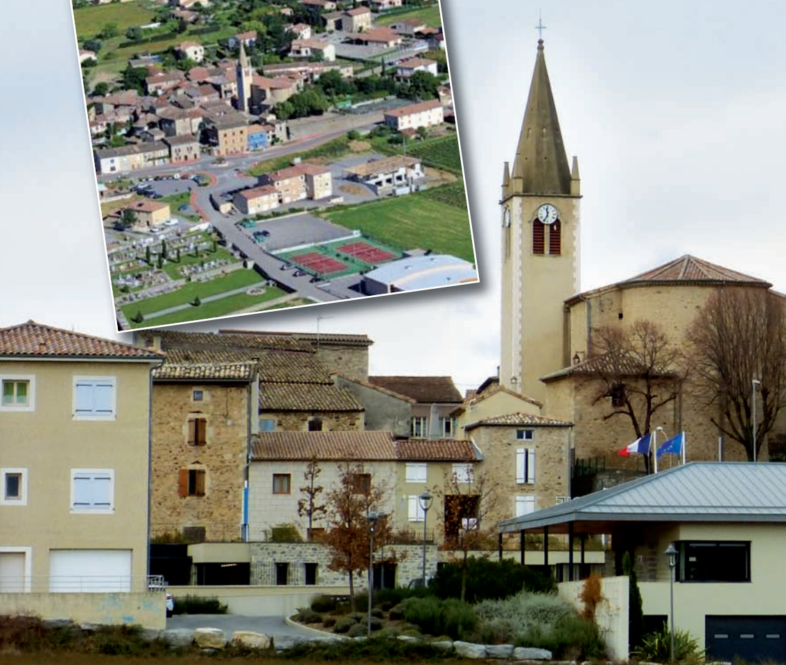
Vue depuis le chemin de Vogüé.