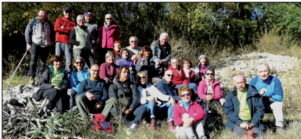
A Balazuc le 15/11/2017.

Randonnée du mardi après-midi : 150 à 500 m de dénivelé et entre 7 et 12 km de distance.