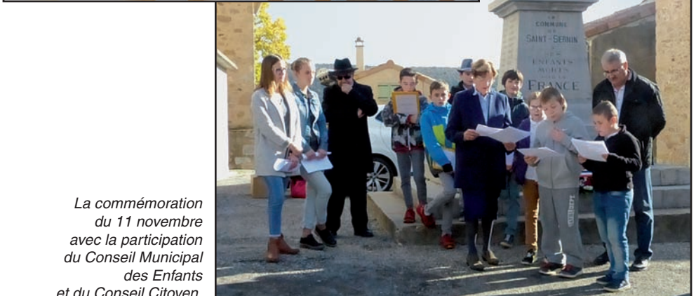
La commémoration du 11 novembre avec la participation du Conseil Municipal des Enfants et du Conseil Citoyen.