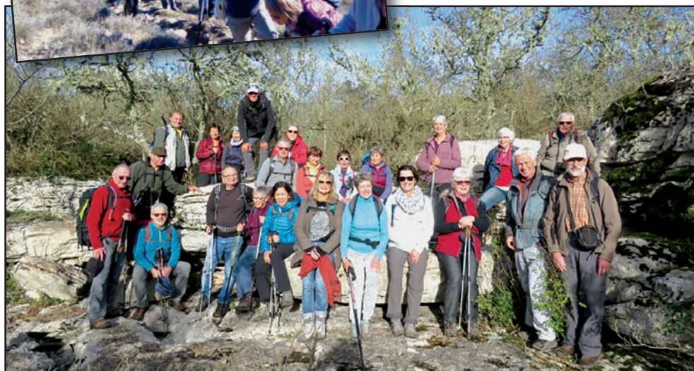
Les dolmens de Saint-Alban-Auriolles

Pour toute demande d'informations complémentaires, vous pouvez contacter le président : Patrick HOFLEITNER 06 84 63 80 51 lespiedsdevinobre@gmail.com Le bureau