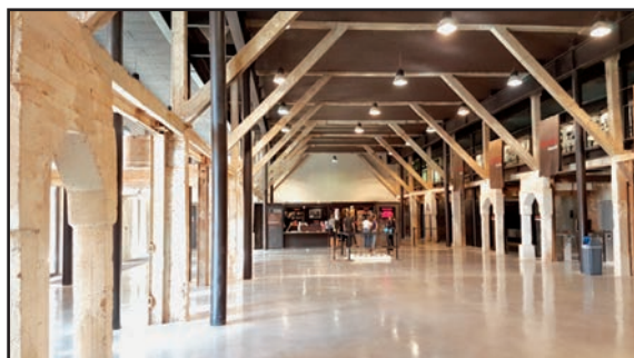
Visite du camp des Milles