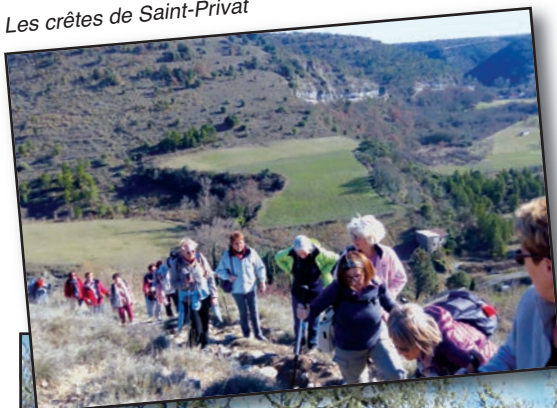
Les crêtes de Saint-Privat

Pour toute demande d'informations complémentaires, vous pouvez contacter le président : Patrick HOFLEITNER 06 84 63 80 51 lespiedsdevinobre@gmail.com Le bureau