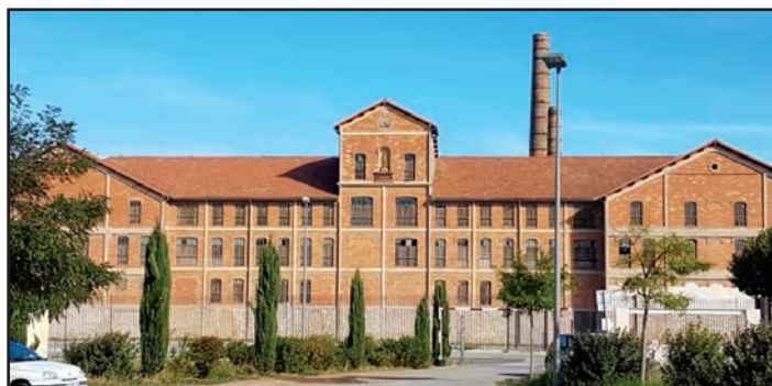
Le camp des Milles

Le camp des Milles est bien ce lieu de mémoire qui ravive la conscience de notre humanité qui doit inspirer les conduites d'aujourd'hui... un beau moment d'éducation citoyenne.