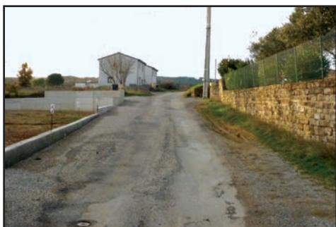
Chemin de la Bruge

Les travaux sur les voiries : emplois partiels bicouche, élargissement des chaussées, chemin de la Bruge, chemin des Gras, prolongement de la chaussée, chemin des Réservoirs, ont été réalisés par l'entreprise SATP d'Aubenas.