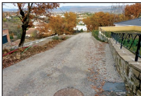
Chemin des Gras

Suite à la demande du Conseil Départemental, la création d'un cheminement piétons et de passages piétons sécurisés au quartier « La Rande » se feront en 2019, car les services du Département vont refaire la bande de roulement de la Route Départementale 579 entre les communes de Saint-Etienne-de-Fontbellon / Saint-Sernin.