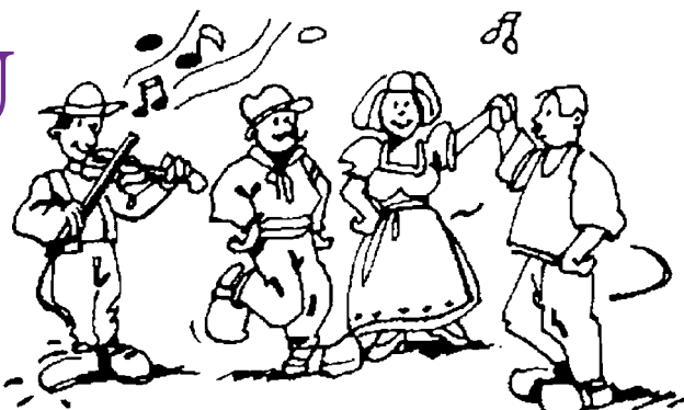
Le groupe Occitan « Castanha e Vinovel ».

L'Association Réseau Folk continue à animer la vie associative locale avec ses ateliers du jeudi soir à 20h30 à l'Espace Culturel de Saint-Sernin, mais aussi un ou 2 bals dans l'année.